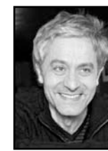
Didier Sandre narrateur (voix enregistrée) [ingénieur du son : Frédéric Prin ]