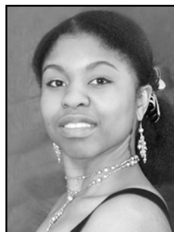
Omo Bello soprano