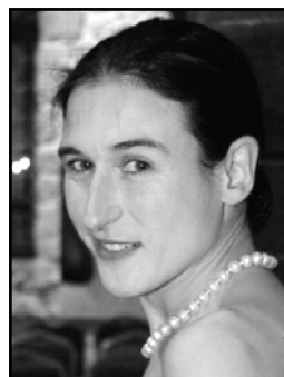
Sylvie Althaparro contralto