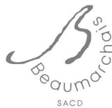
Association Beaumarchais SACD

œuvre composée et concert organisé avec le soutien de :